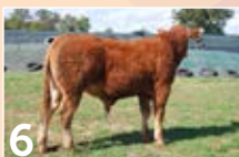
6 EARL BRULE TANGUY ..... P. 9