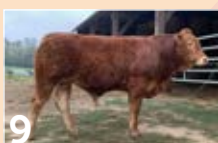
9 GAEC PARNEIX TAKEOVER ..... P. 11