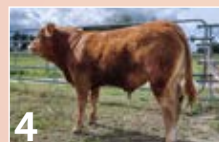
4 GAEC JOSSE TAQUIN ..... P. 8