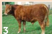
3 GAEC DU PETIT ETANG TINO MH+ ..... P. 8