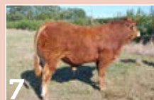
7 GAEC DU MAS TABACO ..... P. 10