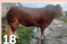
18 GAEC LEBOURG SALAMBO ..... P. 15