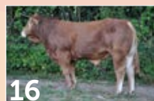
16 GAEC MAZAUD 23 TARZAN ..... P. 14