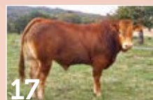
17 SCEA BREGERON SESAME ..... P. 14