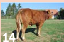
14 GAEC DE COMBAS NOUAILHAS TAZ DNC ..... P. 13