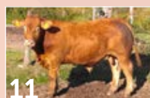
11 GAEC LAPIERRE TCHOUPI ..... P. 12