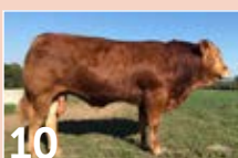
10 SCEA DE CHAUME TIGROU ..... P. 11