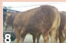
8 GAEC DES SALESSES TALONNEUR P. 10