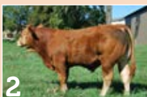
2 GAEC COGNE TENDRE ..... P. 7