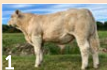
1 GAEC LOULERGUE UGGY SC ..... P. 7